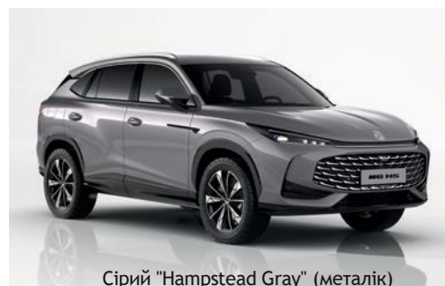
Сірий "Hamstead Gray" (металік)