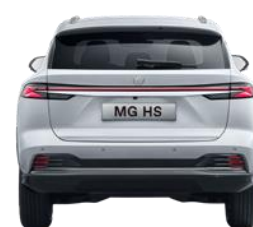
Колія задніх коліс 1584 мм