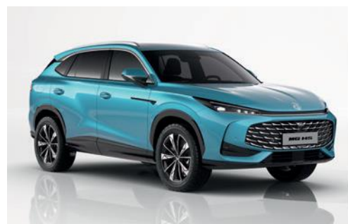
Блакитний "Arctic Blue" (лак)