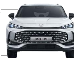
Колія передня 1590 мм Ширина 1890 мм