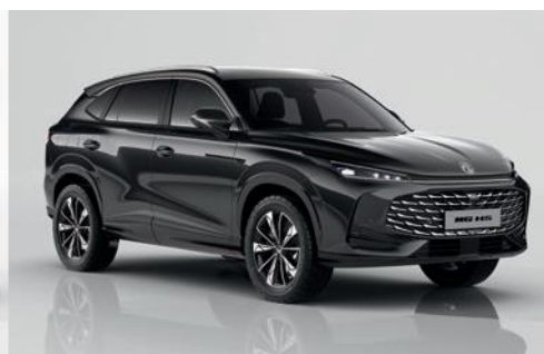
Чорний "Pebble Black" (металік)