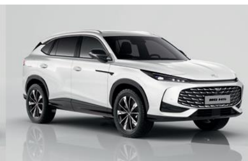
Білий "Pearl White" (металік)