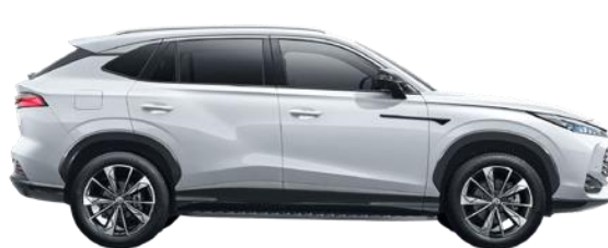
Колісна база 2765 мм Довжина 4655 мм