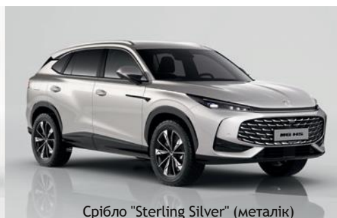
Срібло "Sterling Silver" (металік)